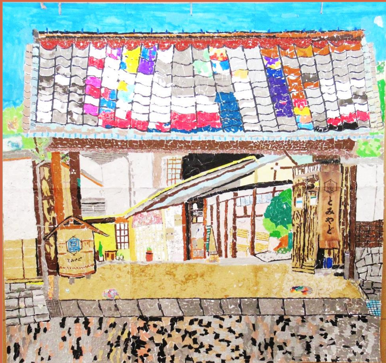
「とみやど」(ちぎり絵) 令和6年度作品