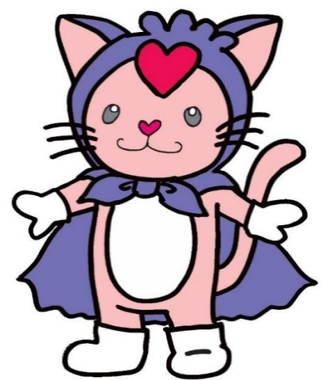
富谷市社協マスコット とみゃん

令和6年度富谷市社会福祉協議会法人化40周年を記念し、より多くの地域の皆さまに本会の活動を知っていただくため、市民から親しまれ、愛着が持たれるマスコットキャラクターを児童、生徒から募集しました。令和6年11月30日に開催した法人化40周年記念祭において誕生した「とみゃん」は、この1年の間様々な場面で活躍しています。