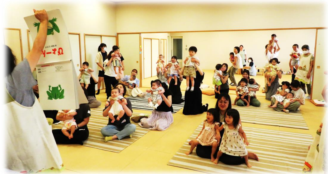
【親子の居場所／子育てサロンとことこ】