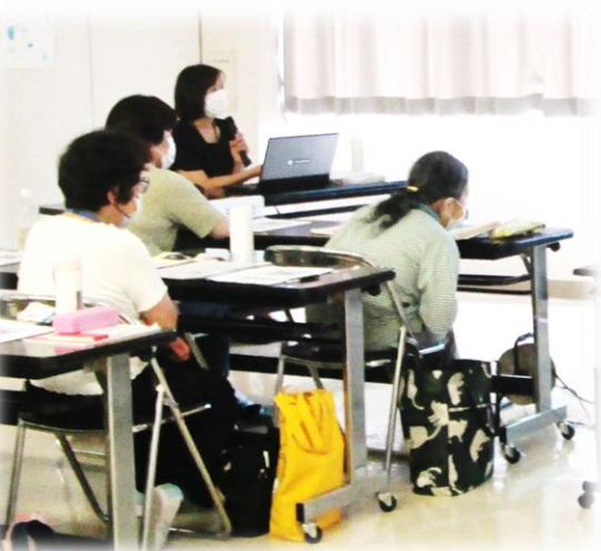
【認知症の理解と支援を学びます】