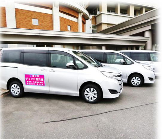
【地域で支えるデマンド型交通】