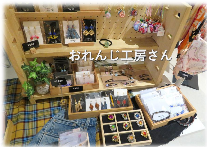
おれんじ工房さん