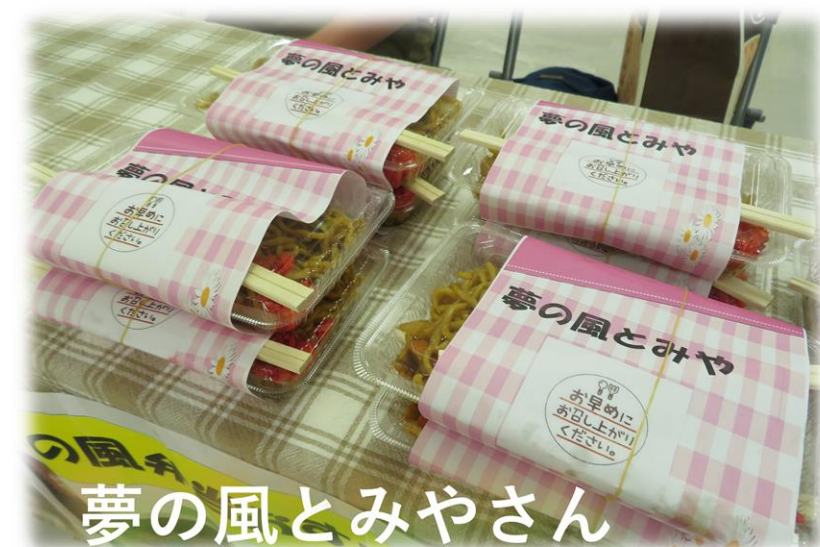
夢の風とみやさん