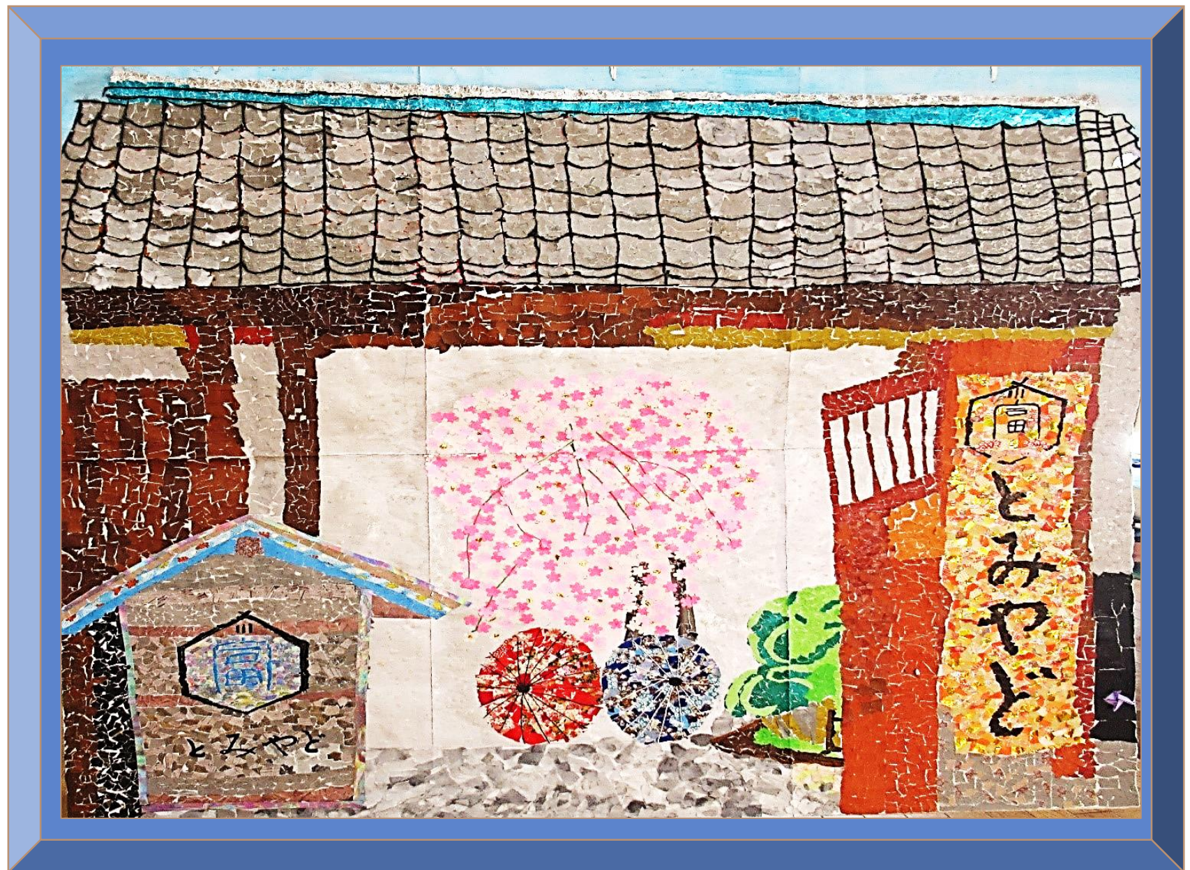
「とみやど」(ちぎり絵) 令和7年度作品

富谷市地域活動支援センター TOMOTOMO・YOUYOU(トモ ユー)は、富谷市内にお住いの障 がいを持つ方が、創作活動や受注作 業、地域社会との交流を通して日 常生活や社会生活の自立を目指す 通所施設です。富谷市からの指定 管理を受けて、富谷市社会福祉協 議会が運営しています。 毎年、開催している「風の心アート 展」に出展した作品をご紹介します。