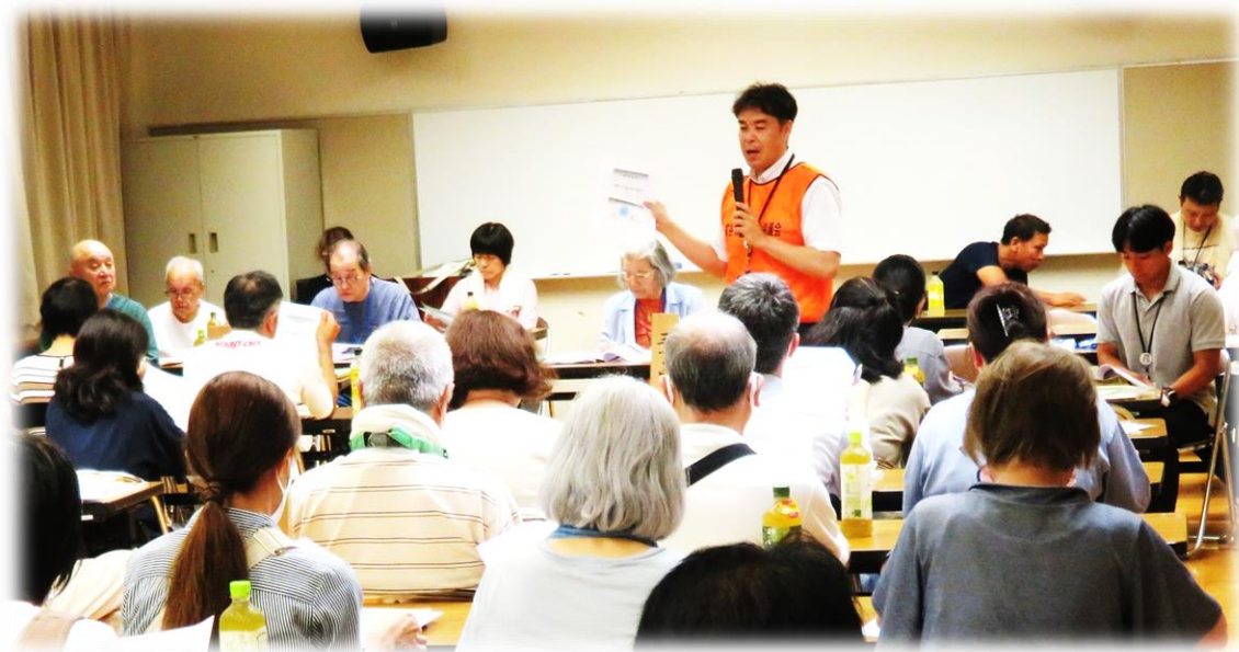
【社協ってなあに？／これから地域に出向きます】

申込者の希望テーマや内容に沿って開催します。地域のお祭りに出向くなど開催方法も柔軟に対応できます。