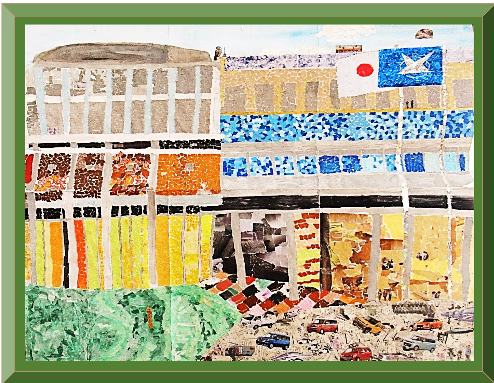
「富谷市役所」(ちぎり絵) 令和7年度作品

天気の良い日には、 写生に出かけました。 大きな作品は、みんなで協力 し合って完成させました。