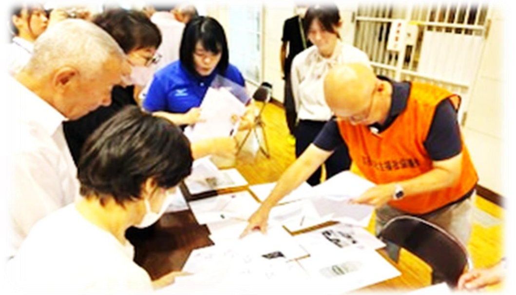
【災害ボランティアセンター設置訓練】