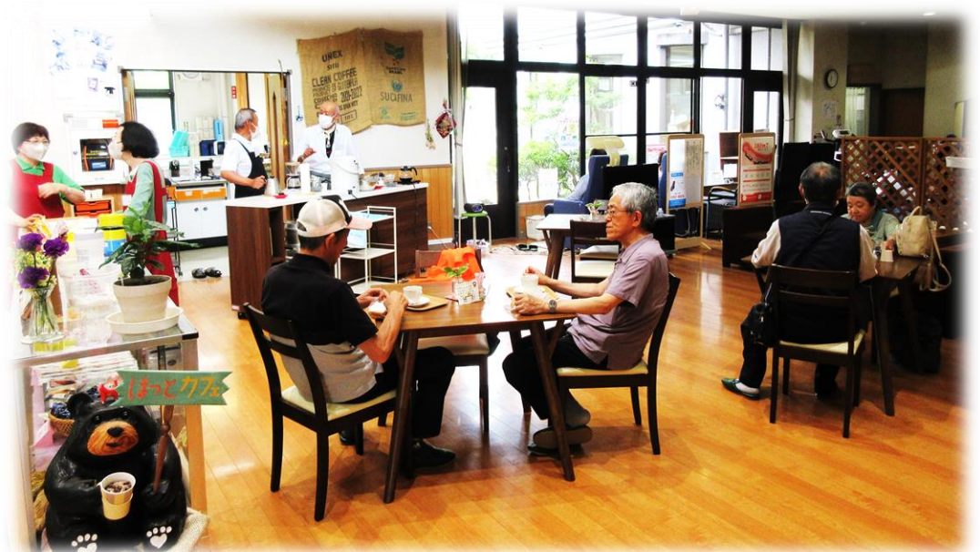
【富谷市指定管理施設／福祉健康センター運営】