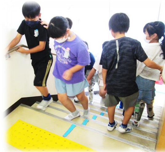
【キャップハンディ体験】