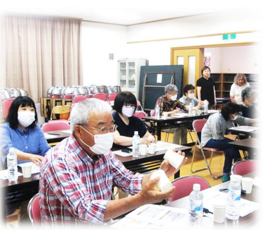
【防災講座／ランタンづくり】