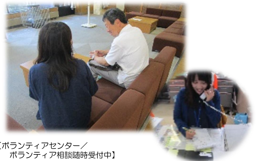
【ボランティアセンター／ ボランティア相談随時受付中】