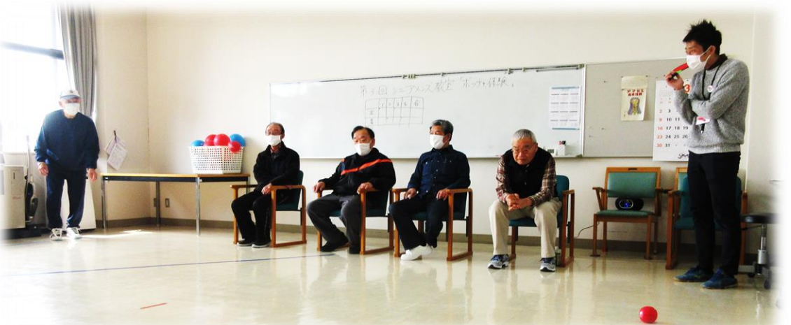
【福祉健康センター出前講座／ボッチャ体験】