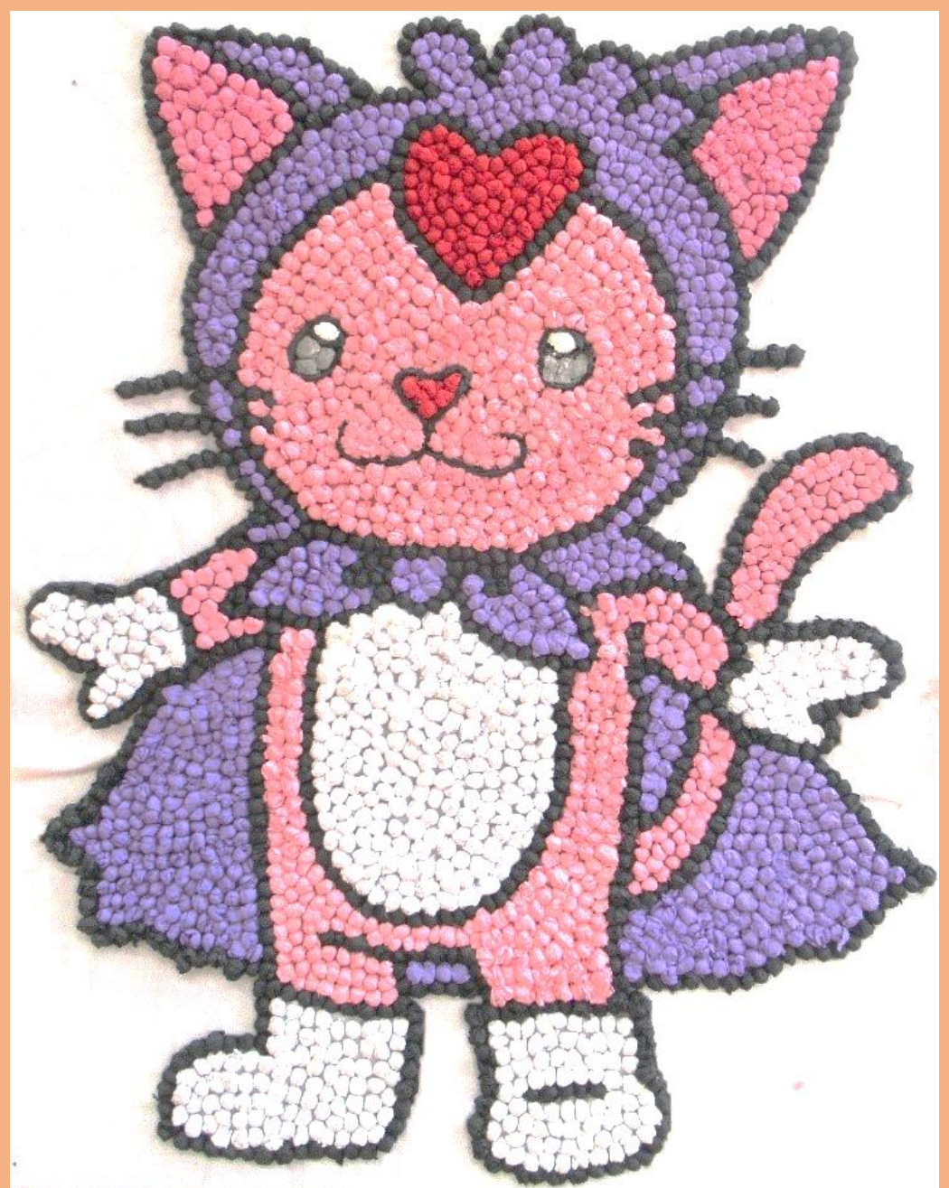
「とみゃん」(花がみアート)

社協のマスコットキャラクター「とみゃん」のイラストは、とみゃんの色に合わせた花がみをひとつひとつ丁寧に丸めたものを貼付けました。