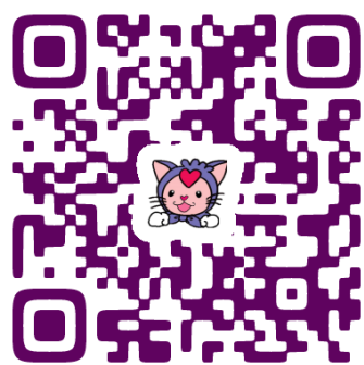
社協ホームページ