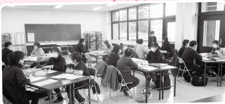
▲施設毎の懇談では活発な意見が交わされました。

『とみサポこころね』の活動は、コロナ禍以降、感染症等で施設への訪問が制限されていましたが、昨年の事業共有会以降、少しずつ緩和され、全ての施設で訪問可能となりました。