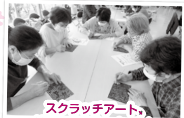
スクラッチアート、綺麗に出来ました!!★

●申請については、お住いの地区の民生委員児童委員にご相談・お申込みをお願い致します。