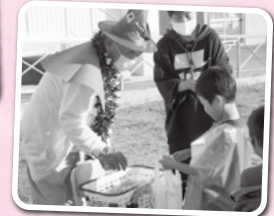
ハロウィンなど行事を楽しんだり