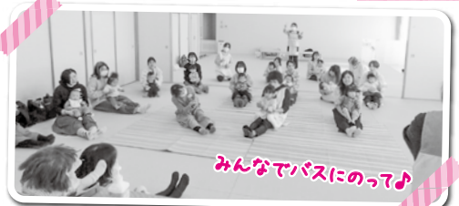
みんなでバスにのって♪