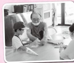
折り紙を楽しんだり