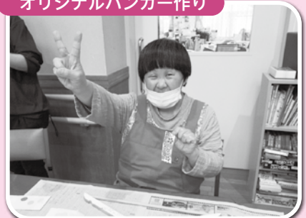
▲トールペイントで模様付け!