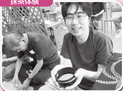
▲美味しく抹茶を点てることが出来ました!