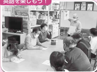
▲クイズ形式で英語を学びました!