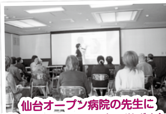
仙台オープン病院の先生にお越し頂いての健康講座で学びました。

10月と11月の虹いろ会食サロンでは、スクラッチアートを楽しんだり、仙台オープン病院の講座で健康について学びました。