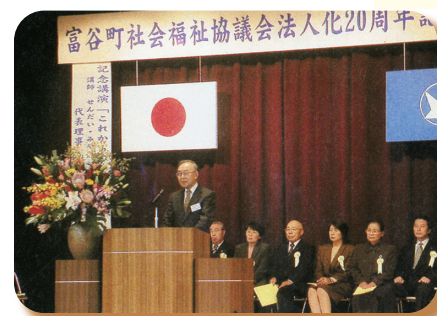
▲平成16年 法人化20周年記念大会