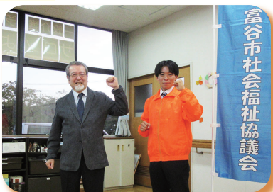
▲ 令和6年 酒田市災害ボランティアセンターへ職員応援派遣