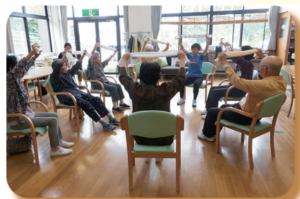
▲ 平成 30 年 サロンより愛「運動教室」