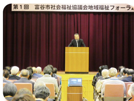
▲ 平成 29 年 第 1 回地域福祉フォーラム