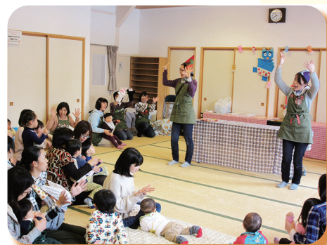
▲ 平成 26 年 「とことこ」子育てサポーターの手あそび