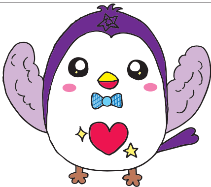
とみっとりーくん