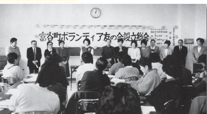
▲平成元年 富谷町ボランティア友の会設立