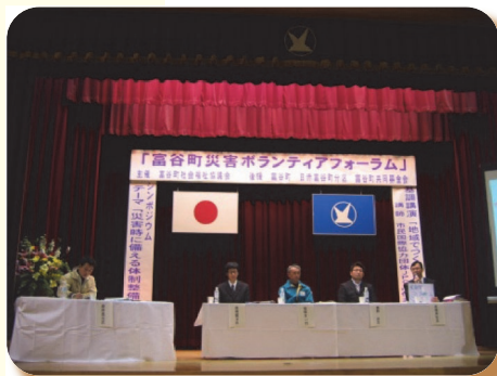
▲平成18年 災害ボランティアフォーラム