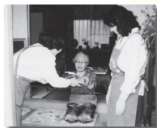
▲平成3年 昼食宅配サービス事業の開始