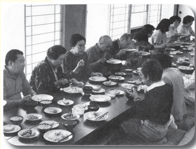
▲昭和61年 老人会食交流会の実施