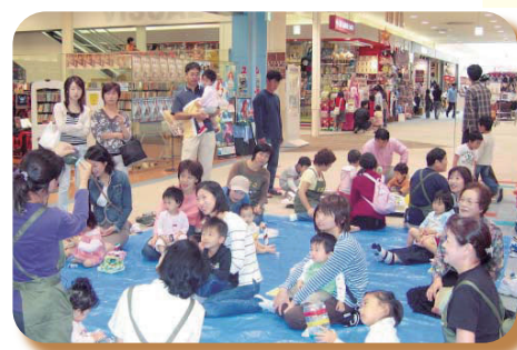
▲平成18年 子育てサロン「とことこ」事業開始