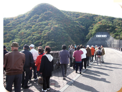
▲ 平成 22 年 二人暮らし高齢者交流会 「さわやか交流会」の開始