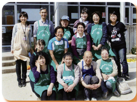
▲ 平成 24 年 山元町での炊き出し