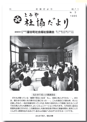
▲昭和60年 社協だよりを発行開始