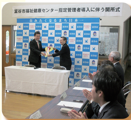
▲ 平成 29 年 福祉健康センター開所式