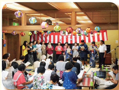
▲ 平成 30 年 福祉健康センター 夏まつり