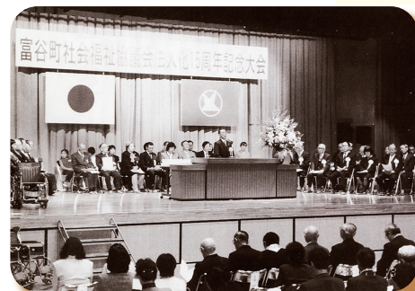
▲平成10年 法人化15周年記念大会