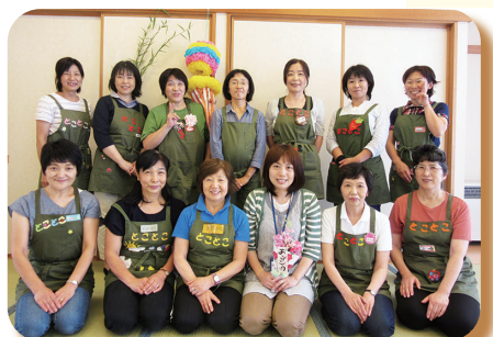
▲ 平成 27 年 「とことこ」子育てサポーター