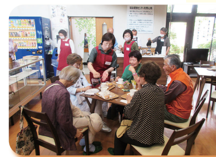
▲ 令和5年 ほっとカフェ