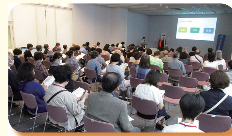
▲ 令和4年 第5回地域福祉フォーラム(イオンモール富谷にて)