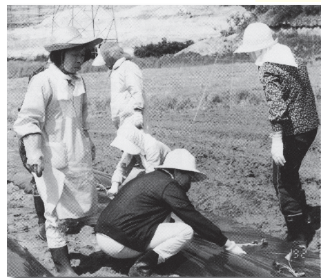
▲昭和62年 ボランティア菜園づくり事業の実施