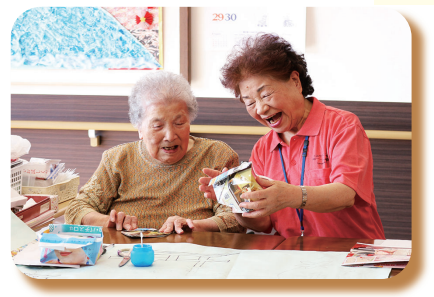
▲ 令和元年 とみサポころね