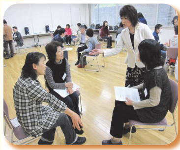
▲ 平成 23 年 傾聴ボランティア養成講座