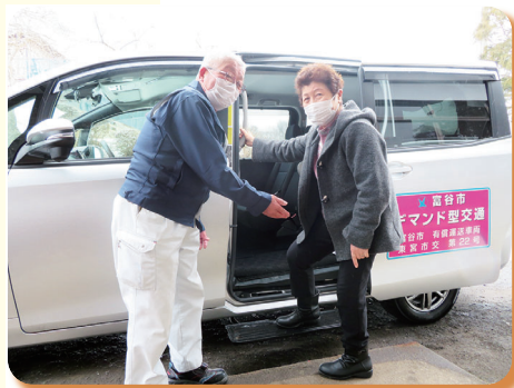
▲ 令和2年 デマンド型交通