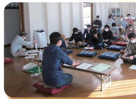
▲ 令和3年 福祉出前座談会