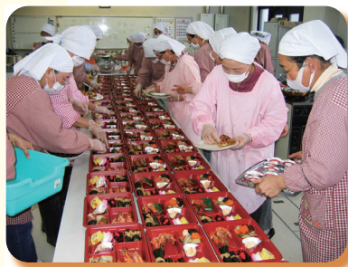
◀ 平成 25 年 「つくし会」おせち料理づくり