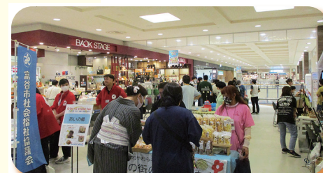
▲ 令和5年 なないろ stand fair