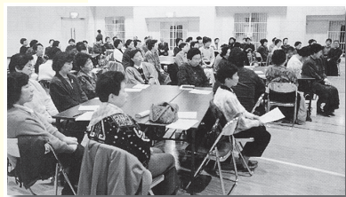
▲平成6年 ボランティアのつどい