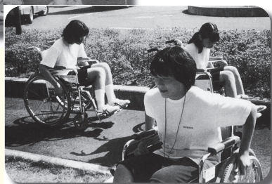
▲平成12年 中学生ボランティア教室