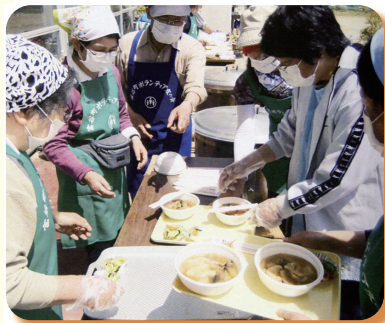
▲ 平成 24 年 山元町での炊き出し 「美味しいはっと汁どうぞ」