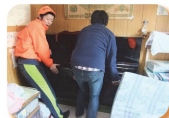
▲ 平成 23 年 災害ボランティア活動