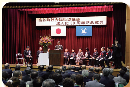
▲ 平成 26 年 法人化 30 周年記念式典