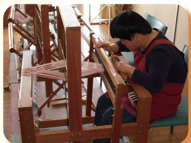
▲ 平成 27 年 TOMOTOMO YOUYOU 創作活動「さをり織り」