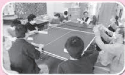
▲真剣勝負だ！負けたくないぞ！