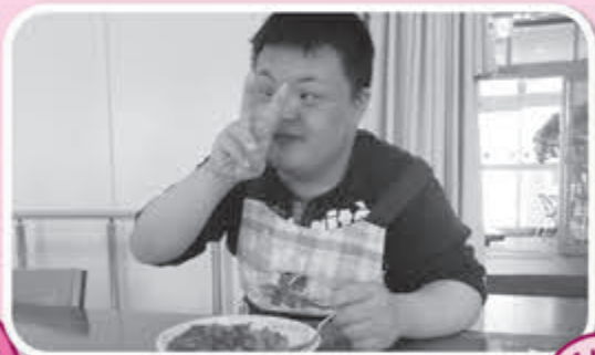
▲皆で協力して作ったメニューは格別です！

調理実習は、日常生活における調理技術の習得を目指し、月毎にテーマを決めて調理します。作ったメニューを家庭でも取り組んでいただき、更なる技術の向上を促しています。