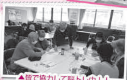
▲皆で協力して脳トレ中!!