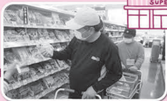
▲品質や価格、量等を考慮し購入します！