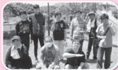
▲ウォーキングで気分転換

◎ご利用には登録が必要となりますので富谷市保健福祉部地域福祉課 ☎358-3294 までお問い合わせください。