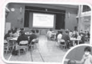
▲事業内容の再確認と施設ごとにグループワークを行いました

令和5年度を以ってモデル事業が終了し、今年度より社協が主体となって実施することとなりました。5月22日(水)、気持ち新たに「事業共有会」を開催し、関係者約50名が一堂に会し、本格始動に向け事業内容の再確認と今後の活動内容について話し合いを行いました。