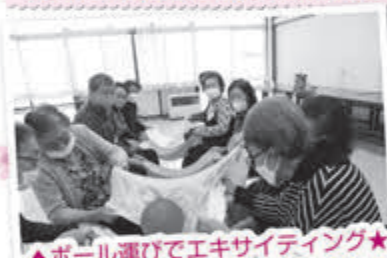
▲ボール運びでエキサイティング★

4月の虹いろ会食サロンでは職員レクリエーションを行いました。皆さんでおしゃべりしながら楽しい時間を過ごしました。