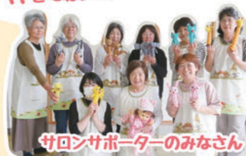
サロンサポーターのみなさん