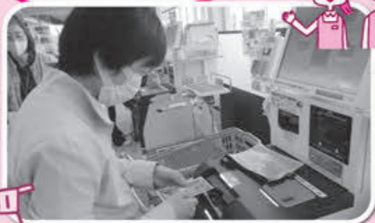
▲セルフレジの使い方も覚えます！

買物実習は、調理実習で使う食材の購入と会計を通じて金銭管理の習得を目標として取り組んでいます。