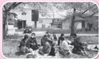
▲桜の下でのひととき

4月は「お花見🌸」に東向陽台のグリーンベルトへ外出しました。青空の下を歩き・遊び、お団子を食べ「久しぶりに散歩をして気持ちがいい☺️」という声が聞かれました。5月は参加者より希望が多かった「レクリエーション・軽運動を楽しもう！」で開催。卓球バレーは白熱した戦いになり歓声があがりました。笑顔多く過ごした時間となりました。