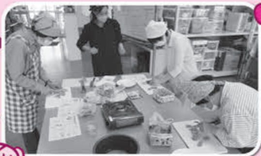
▲各グループ役割分担して、調理します！