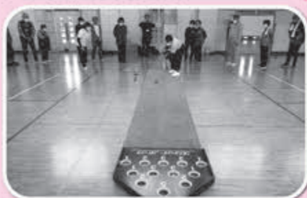
▲定期的な開催を望む声がありました！

11月16日(水)、福祉健康センター利用者との交流会を行いました。混合チームでゲームを楽しみ、得点が入る度にチームは大盛り上がり！交流を深め、楽しいひと時を過ごしました。