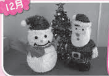
▲イオン富谷店さんからの