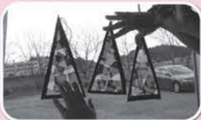
▲お日様の光でキラキラ綺麗