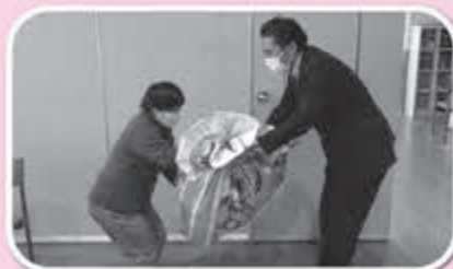
▲大切にに使わせていただきます。

例年、季節行事で交流しておりますイオン富谷店様より、当センターへご寄付をいただきました。感染症対策のため今年も交流会は開催できませんでしたが、クリスマスツリーや装飾品等頂き、一緒に装飾しました。