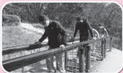
▲アスレチックも楽しかった！

10月は「外出をして紅葉を楽しもう！」と題し、おおひら万葉クリエートパークへ行ってきました。天候も良く久しぶりの外出企画とあって参加者の表情も晴れやかに感じました。11月の「スタンドグラス風の飾りを作ろう！」では、形を変えるとクリスマスツリーにもなる創作を行いました。参加者の感性があふれる楽しいデザインに作品発表の場も大いに盛り上がりました。