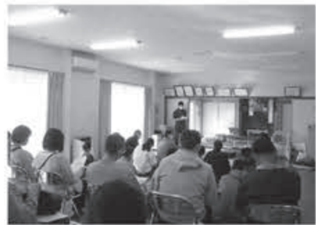
▲出前座談会の様子

社協福祉出前座談会では、子育てから高齢分野まで生活に密着したテーマをご用意しております。ぜひお気軽にお声がけください。