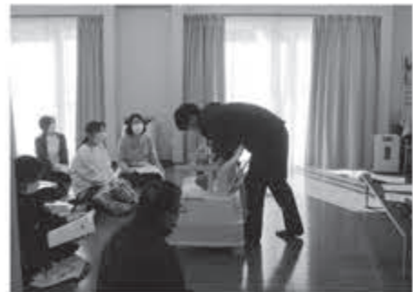
▲災害時のトイレの工夫を説明