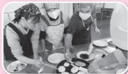
▲五平餅？おにぎり？美味しくなれ！