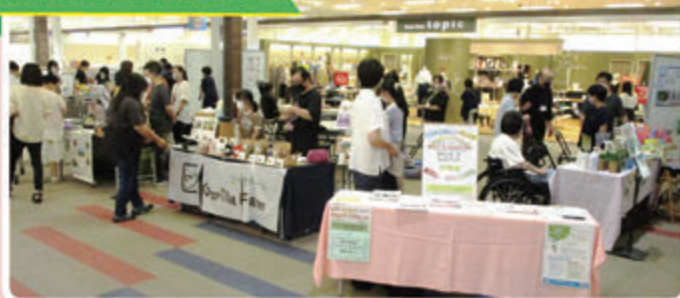
なないろ Stand fair