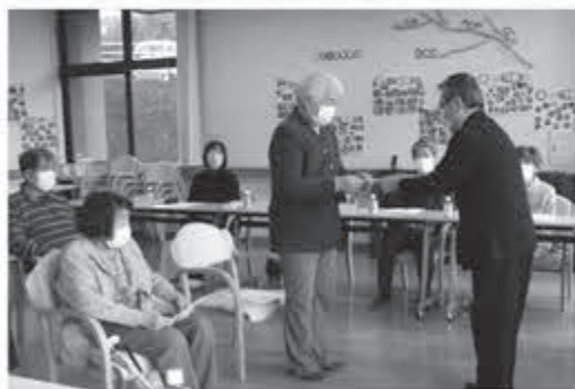
歳末たすけあい募金配分金贈呈式 12月末(個人)・1月23日(団体・学校)