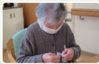
▲一针一针に想いを込めます

利用者さんは「子どもたちの為に頑張って作ろう!」と、裁縫が得意な方もそうでない方も一生懸命作りました。「誰かのために何かをするっていいよね。」との感想も聞かれました。