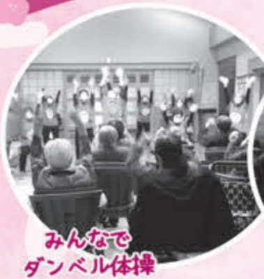
みんなで ダンベル体操