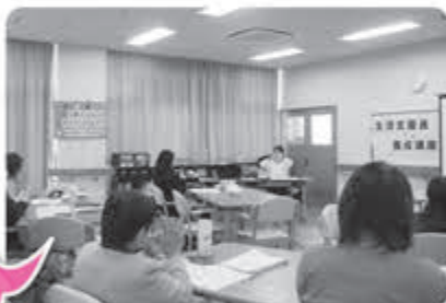
今年度の講座の様子

活動を行うにあたっては、生活支援員養成講座を受講いただいています。今年度は、6月と1月の2回開催しました。次年度も開催予定ですので、広報または社協だよりをご覧ください。皆様のご支援お待ちしております。