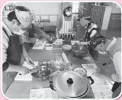
▲役割分担してお雑煮作り

1月の調理実習は、お雑煮やあんこ餅等を調理しました。会食交流後、小正月行事を行い、紙相撲や福笑い等伝統的な遊びを楽しみながら過ごしました。