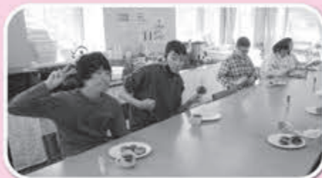
▲色々な形が並びました

◎ご利用には登録が必要となりますので富谷市保健福祉部地域福祉課 ☎358-3294) までお問い合わせください。