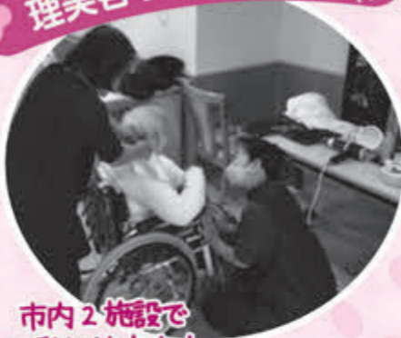
市内2施設で 活動継続中！！