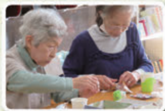
▲真剣に黙々と作ります!