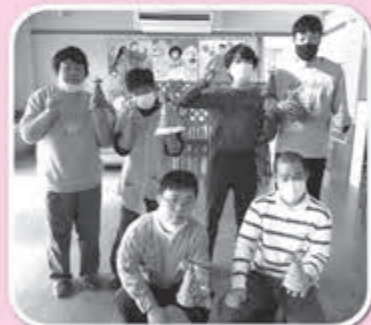
▲個性的なツリーが完成です

12月は「クリスマス飾りを制作しよう！」をテーマに、紙の土台に毛糸を巻き付け素敵なツリー飾りを製作しました。1月は「お米で五平餅風団子を作ろう！」というテーマで開催。炊き立てのご飯をつぶし、好きな形に丸めて甘味醤油に絡め、ホットプレートで焦げ目がつくまで焼きました。いい香りが漂い、参加者の食欲をそそりました😊