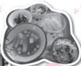
調べて 新年の 特別メニュー