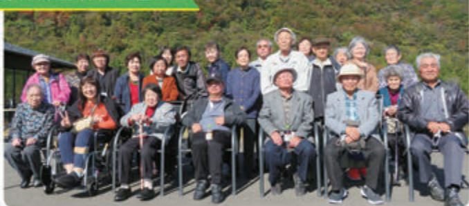
身体障害者福祉協会