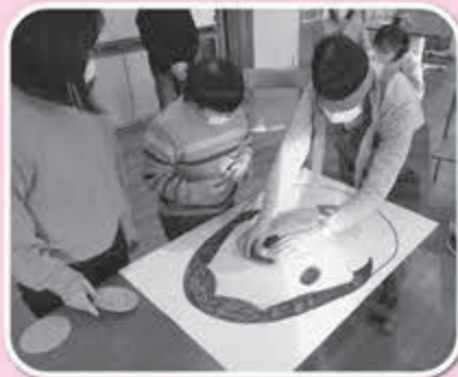
▲仲間の声を頼りに！