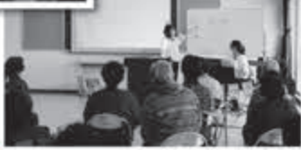
とみやHAPPYリトミック 音楽を楽しみました♪▶