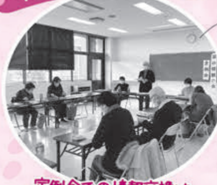
定例会での情報交換は 欠かせません

富谷傾聴の会の活動は、個人宅傾聴がスタートし、定例会ではその報告もあがります。活動中の悩みなどが共有されることで、その後のより良い活動につながっています。