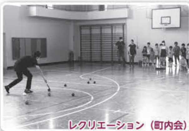
レクリエーション (町内会)