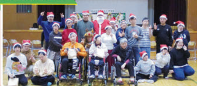
手をつなぐ育成会