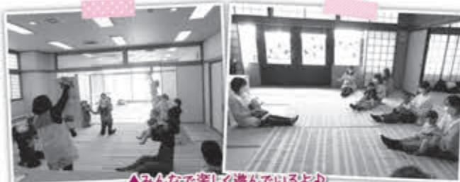
▲みんなでも楽しく遊んでいるよ♪