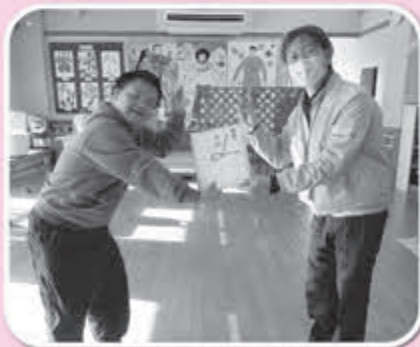
▲清掃用具等ご寄付を頂きました