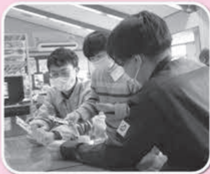
▲ビンゴゲームを楽しむメンバーと社員さん