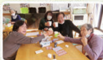
▲お茶っこ飲みながら★