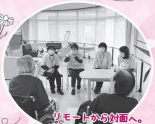
リモートから対面へ。 活動も変化しています。

本来の“寄り添い”活動とはまだまだいきませんが、入居者さんとの関係性ができ、施設スタッフとの連携も生まれ、この活動が根付いているように感じます。