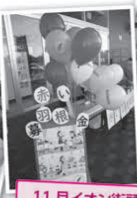
11月イオン街頭募金活動