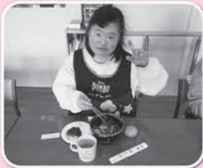
▲美味しく作ることが出来ました！