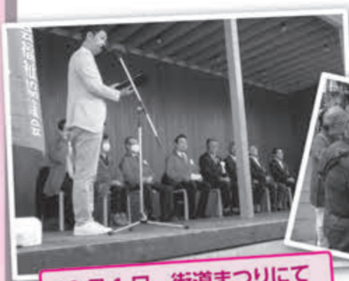
10月1日 街道まつりにて 進発式と街頭募金活動