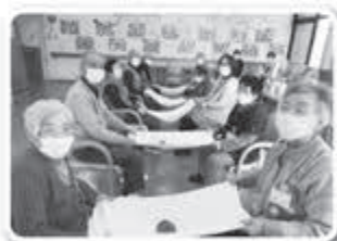
▲カメラ目線バッチリ