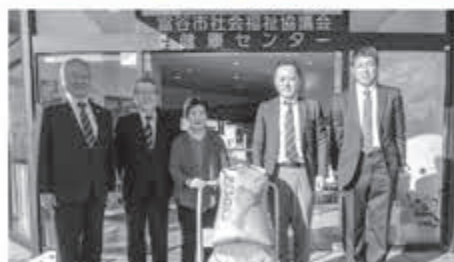
▲タカラ米穀株式会社様よりいただきました。