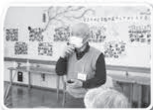
▲自己紹介緊張しますね

新しいメンバーが集まった火曜日は、緊張しながらも自己紹介をして、最後には和気あいあいとした雰囲気になっていました。今年度も笑顔溢れる、楽しいサロンにしていきたいです♪