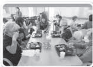
▲ごはんもとっても美味しいです♪