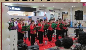
▲ボラセン PR イベント

ボランティア活動について、市民の方に広く知ってもらえるよう働きかけます。(ボランティアセンター日より(奇数月発行の広報内)、社協ブログ・HPなど)